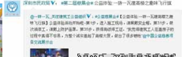
9月22日，深圳市民政局微博